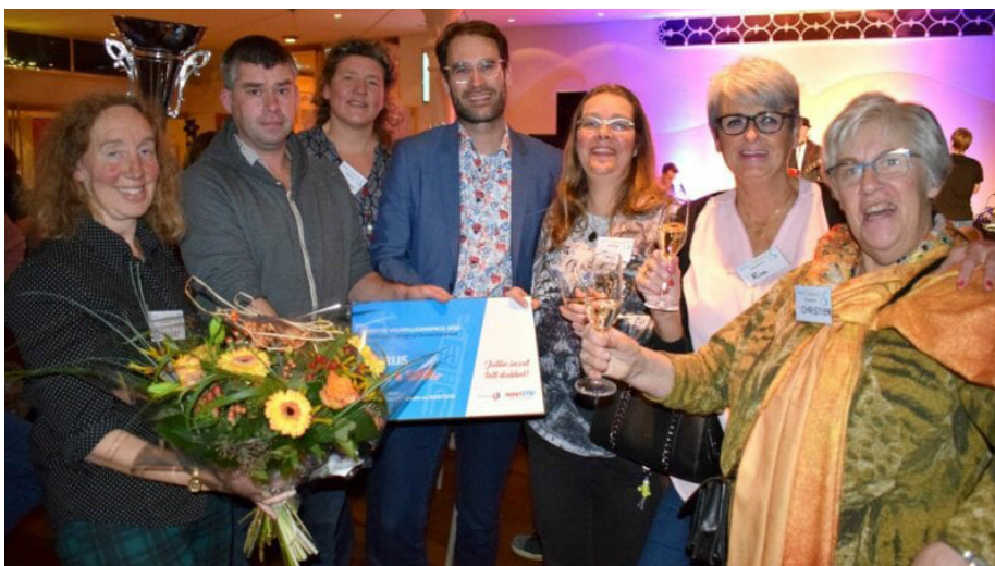
De vrijwilligers van speeltuin Oosterkwartier

eniging stageplaatsen voor jongeren van Speciaal Onderwijs De Stroom. Na een jaar van investeren in de speeltuin ontvingen de vrijwilligers daarom afgelopen zaterdag de eerste prijs.